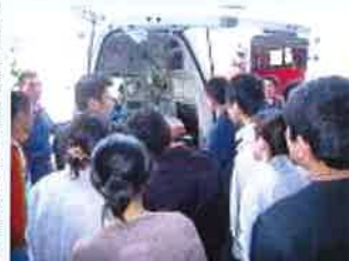
救急車の中を見学

集合研修時にいつも実施している警察署の方による交通安全、消防署の方による火災予防・消火器の使い方実習に加え、今回初めて富山市環境センターの方にゴミの分別についての講習をしていただきました。今後の日本での生活にとっても役立つ内容で、大変参考になりました。