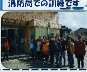
消防局での訓練です