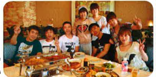
一番人気の料理は、「牛すじ」でした。