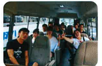
↑ 楽しかった1日… 帰りのバスの車内で