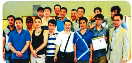
↑ 久しぶりに集まった同僚と記念撮影 会場の様子！

今年入国したばかりの実習生も、職場の方への感謝の気持ちや今後の目標などを、心を込めて伝えました。